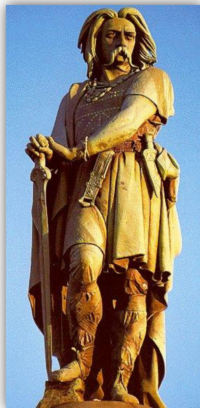
Vercingétorix (80-46 av J.-C.):

C'est l'un des nombreux chefs gaulois. A l'époque il y avait peu d'unité entre les différentes tribus qui peuplaient la Gaule. Vercingétorix a réussi en 52 avant J.-C. à fédérer les différents peuples gaulois pour résister face aux troupes romaines. Voilà pourquoi il est devenu le symbole de la résistance mais aussi l'un des premiers grands chefs de la Gaule toute entière.