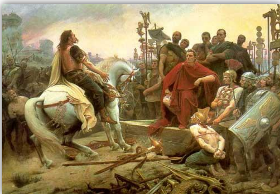
Vercingétorix dépose ses armes aux pieds de César

C'est l'un des nombreux chefs gaulois. A l'époque il y avait peu d'unité entre les différentes tribus qui peuplaient la Gaule. Vercingétorix a réussi en 52 avant J.-C. à fédérer les différents peuples gaulois pour résister face aux troupes romaines. Voilà pourquoi il est devenu le symbole de la résistance mais aussi l'un des premiers grands chefs de la Gaule toute entière.