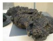
Côte de maille