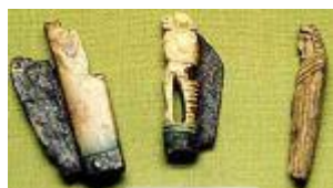
Couteaux à lames repliables