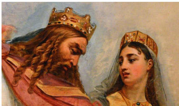
Clovis et sa femme Clotilde

Son exemple est suivi par l'ensemble de ses guerriers et il devient le premier roi catholique de l'Occident chrétien. Clovis reçoit alors le soutien des évêques et du peuple gaulois, en majorité chrétien. Ce soutien lui permet d'étendre son royaume dont il fixe la capitale à Paris.