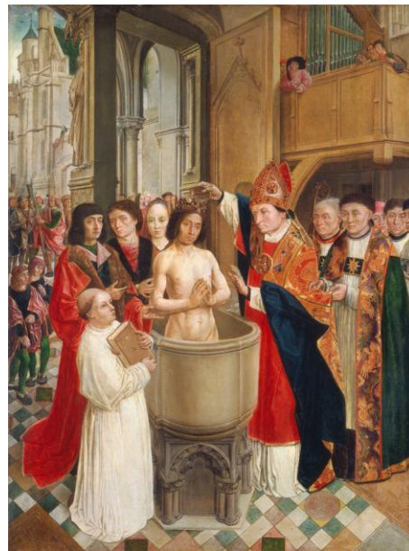
Le baptême de Clovis

En souvenir du baptême de Clovis, l'Église conçut une autre cérémonie : le sacre des rois de France. Le jour de leur couronnement, dans la cathédrale de Reims, l'évêque déposait un peu d'huile sainte sur leur front, pour montrer que leur pouvoir venait de Dieu. Cela dura de 751 jusqu'au sacre de Charles X en 1825.