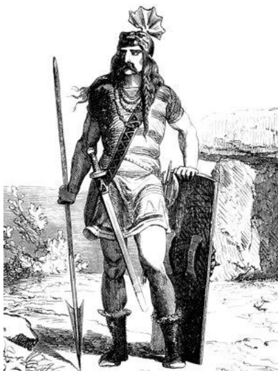
Dessin de Clovis